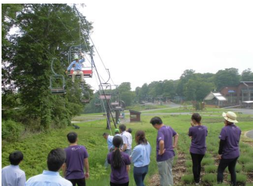
【夏季勤務前救助訓練】