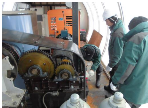
【予備原動機救助訓練】